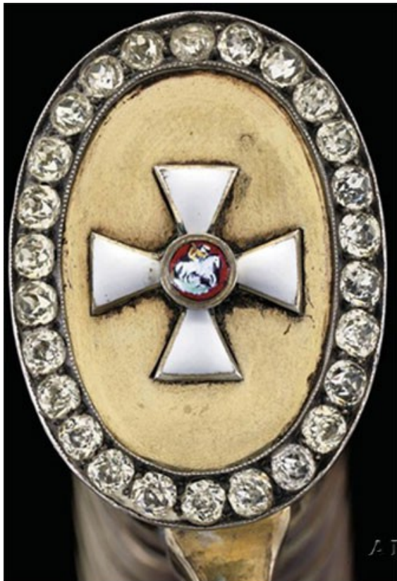
Наградное Золотое оружие

После окончания русско-турецкой войны (1877 - 1878) император Александр II приказал подготовить представления для награждения наиболее отличившихся частей и подразделений. Сведения от командиров об оказанных их частями подвигах были собраны и внесены на рассмотрение кавалерской Думы ордена Св. Георгия. В докладе Думы, в частности, говорилось, что наиболее блестящие подвиги в войну оказали Нижегородский и Северский драгунские полки, которые уже имеют все установленные награды: Георгиевские штандарты, Георгиевские трубы, двойные петлицы "за военное отличие" на мундиры штаб- и обер-офицеров, Георгиевские петлицы на мундиры нижних чинов, знаки отличия на головные уборы.