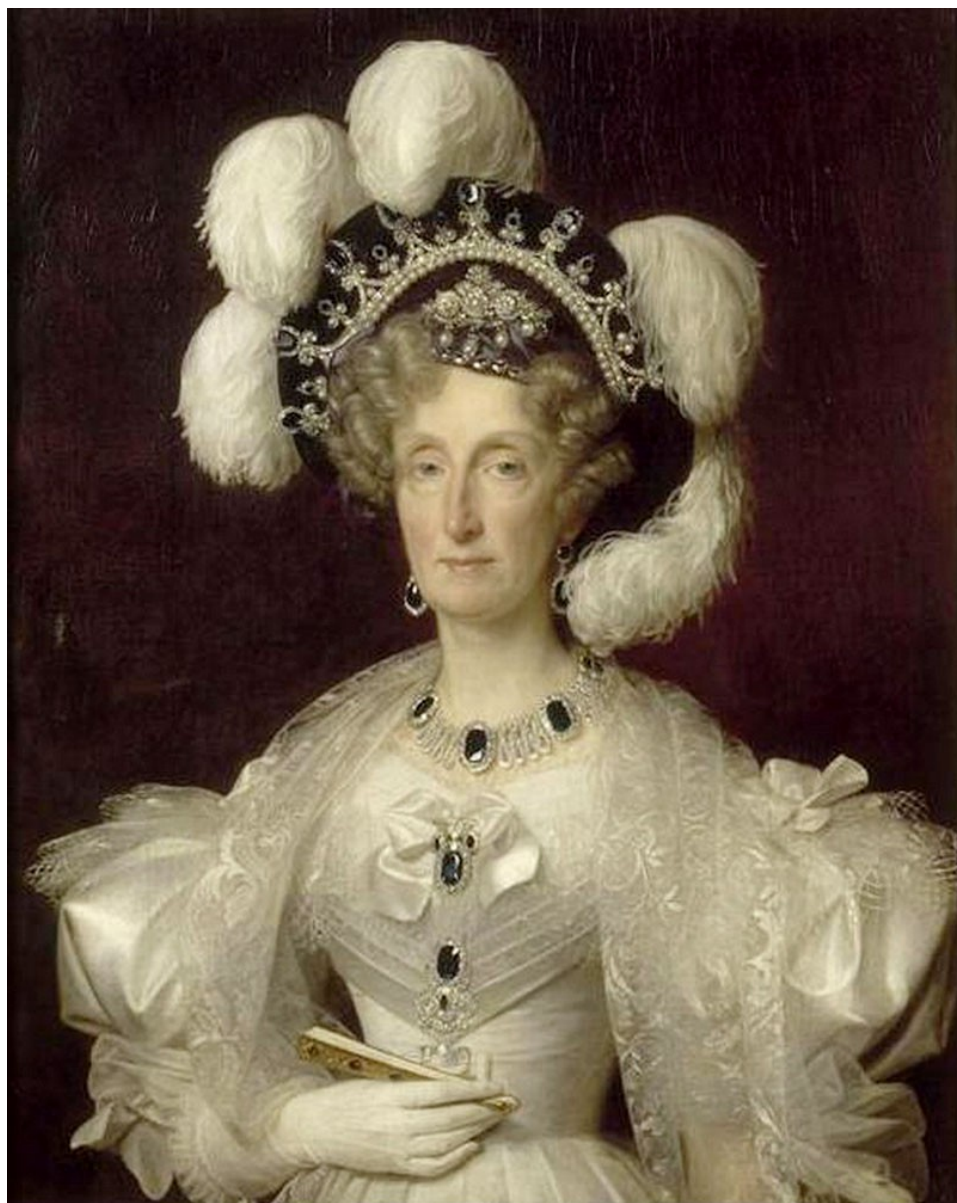
Луи Эрсан. Портрет Марии-Амалии, королевы Обеих Сицилий 1830, Музей Конде, Шантильи.

описание которого было объявлено приказом по Военному ведомству от 31 октября того же года. В указе, в частности говорилось: "Государь Император, имея в виду, что некоторые полки имеют уже все установленные в награду за военные подвиги знаки отличия, Высочайше установить соизволил новое высшее отличие: Георгиевские ленты на знамена и штандарты с надписями отличий, за которые ленты пожалованы, согласно прилагаемым при сем описанию и рисунку. Ленты эти, составляя принадлежность знамен и штандартов, с них ни в коем случае не снимаются". До конца существования русской императорской армии это награждение широкими Георгиевскими лентами оставалось единственным. Эти ленты получили Нижегородский и Северский драгунские полки.