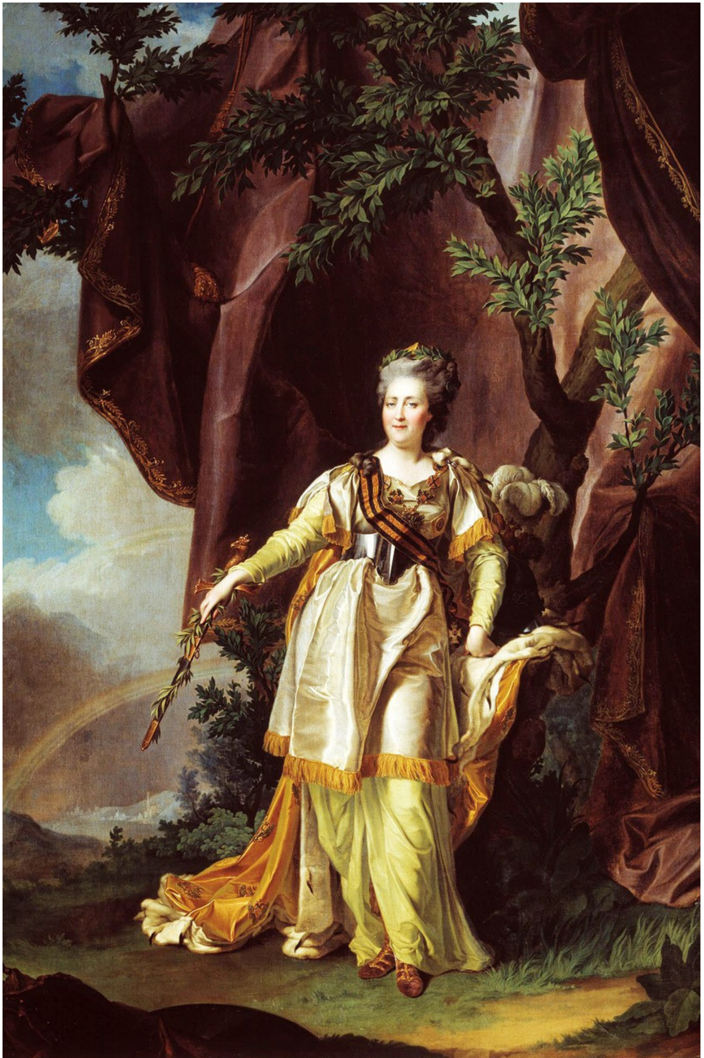
Д.Г. Левицкий. Портрет императрицы Екатерины II.