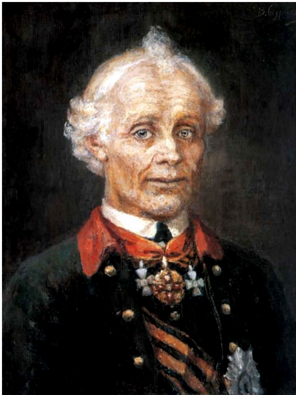
Суриков В.И. Генералиссимус Суворов.

Хотя формально по старшинству орден Св. Георгия 1-й степени стоял ниже высшего ордена Андрея Первозванного, полководцы ценили его выше всякой другой награды. Из письма великого полководца А. В. Суворова дочери от 8 ноября 1789 года: [Получил] знаки Св. Андрея тысяч в пятьдесят, да выше всего, голубушка, Первый класс Св. Георгия. Вот каков твой папенька. За доброе сердце, чуть, право, от радости не умер.