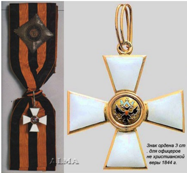
Знак ордена 3 ст. для офицеров не христианской веры 1844 г.