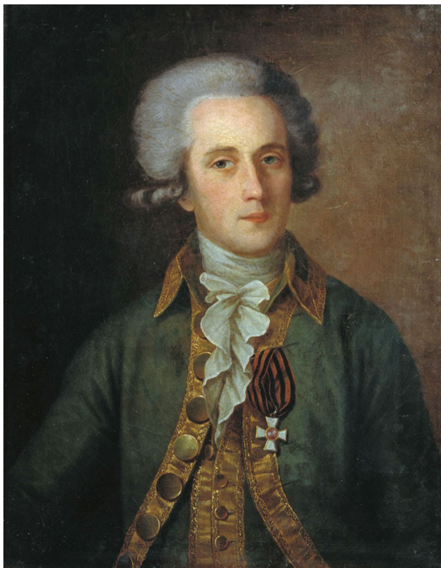
Е. Д. Камеженков. Неизвестный офицер с орденом Георгия IV-й степени. Начало 1790-х гг.

Награждённые несколькими степенями имели право на пенсию только к высшей степени. После смерти кавалера его вдова получала за него пенсию ещё год. Ордена после смерти владельца сдавались в Военную Коллегию (до 1856 года). Запрещалось украшать орденские знаки драгоценными камнями. Орден давал также привилегию на право входа на публичные мероприятия вместе с полковниками для Георгиевских кавалеров 3-го и 4-го классов, даже если их чин был младше.