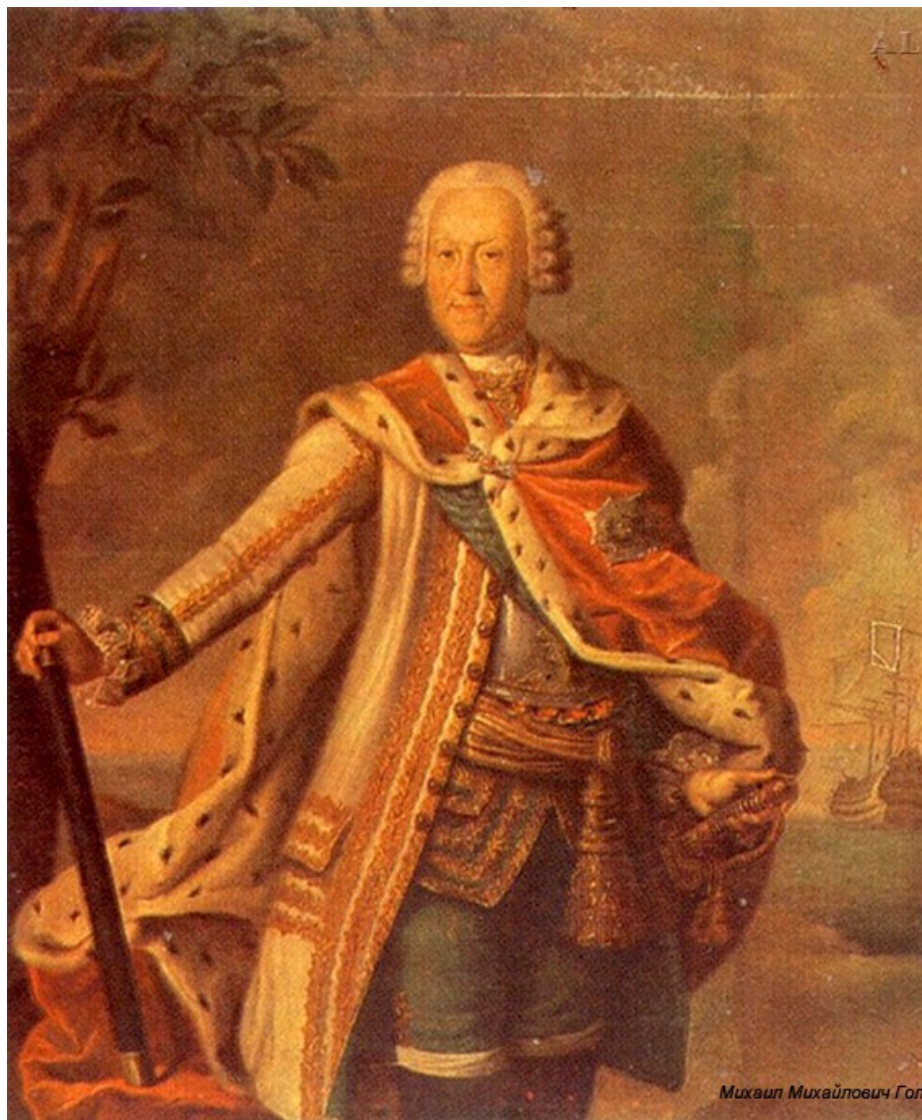
Михаил Михайлович Голицын (1681 - 1764)

указанием конкретных заслуг награждённого).