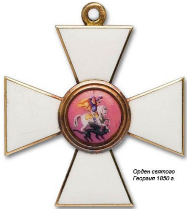
Орден святого Георгия 1850 г.

После окончания русско-турецкой войны (1877 - 1878) император Александр II приказал подготовить представления для награждения наиболее отличившихся частей и подразделений. Сведения от командиров об оказанных их частями подвигах были собраны и внесены на рассмотрение кавалерской Думы ордена Св. Георгия. В докладе Думы, в частности, говорилось, что наиболее блестящие подвиги в войну оказали Нижегородский и Северский драгунские полки, которые уже имеют все установленные награды: Георгиевские штандарты, Георгиевские трубы, двойные петлицы "за военное отличие" на мундиры штаб- и обер-офицеров, Георгиевские петлицы на мундиры нижних чинов, знаки отличия на головные уборы.