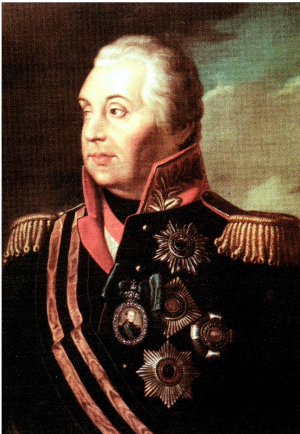
Волков Р.М. Портрет М.И. Кутузова.