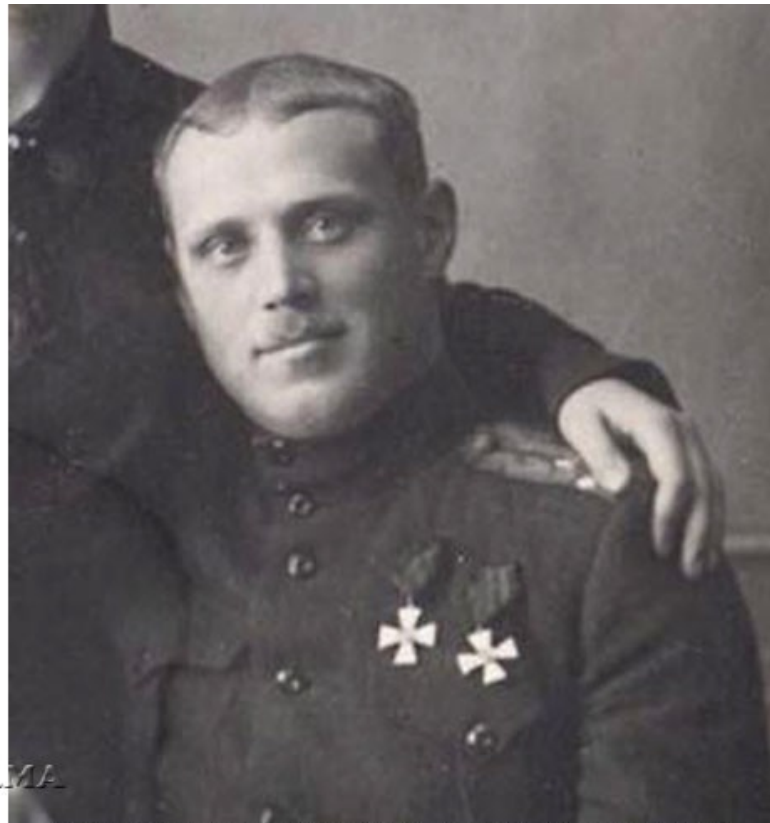
Штабс-капитан 73-го пехотного Крымского полка Сергей Павлович Авдеев дважды награжденный орденом Св. Георгия 4-й степени

Именным указом 11 апреля 1878 года был установлен новый знак отличия,