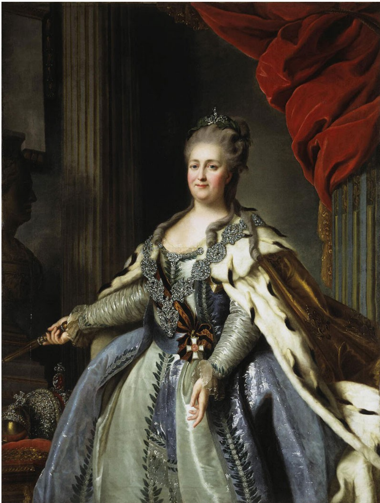
Рокотов Ф. Екатерина II с орденом Св. Георгия 1-й ст. 1770г.