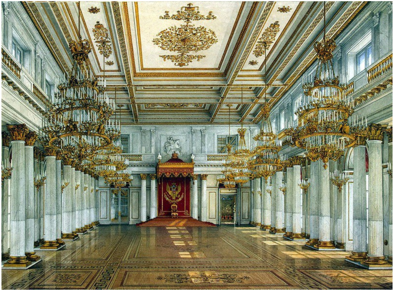
Георгиевский зал в Зимнем дворце.

Заседания Думы ордена Святого Георгия собирались в Георгиевском зале. Ежегодно проходили торжественные приёмы по случаю орденского праздника, для торжественных обедов использовали Георгиевский фарфоровый сервиз, созданный по заказу Екатерины II (завод Гарднера, 1777–1778 гг.) Последний раз георгиевские кавалеры отмечали свой орденский праздник 26 ноября 1916 г.