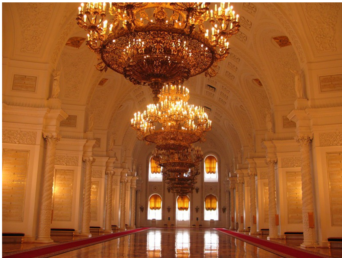
Георгиевский зал. Большой Кремлёвский дворец.

Кроме Георгиевского зала в Зимнем, существует Георгиевский зал Большого Кремлёвского дворца, строительство начато в 1838 году в Московском Кремле по проекту архитектора К. А. Тона. 11 апреля 1849 г. было принято решение об увековечивании имён георгиевских кавалеров и воинских частей на мраморных досках между витых колонн зала. Сегодня на них размещено свыше 11 тысяч фамилий офицеров, награждённых разными степенями ордена с 1769 по 1885 г.